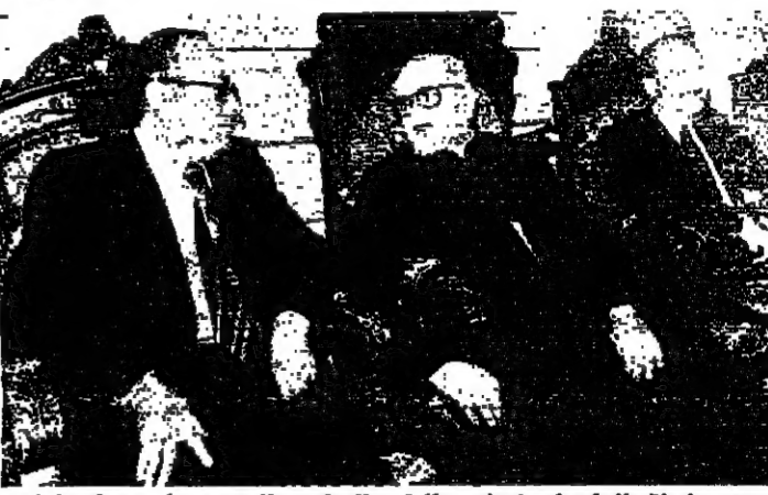
فيبة البطريرك خريش والرئيس المصالح والوزير ساسين في بكركي امس

شبه حريق هائل في المستودع رقم ٦ في مرفأ بيروت عند الساعة الخامسة والنصف مساء امس ، واستمرت عمليات الاخماد حتى فجر اليوم رغم الاضرار النازرة التي حدثت . وقد انتشرت النيران بسرعة نظرا لطبيعة المواد الموجودة في المستودع كالبخور والمواد الكيميائية الاضواء وساعات رجال الاطفاء في بيروت التي انزمت وانضمت القيد ايل نهار بالمسؤولين طلبا للاسماء بالخطية لخطار والذخائر التي كانت في المستودع على تلك النيران قبيل ابتداءها الى الضمان المجاورة ، خاصة العنبر رقم ١١ الذي انجز بناؤه حديثا ، بالإضافة الى اضرار اذائع القوية .